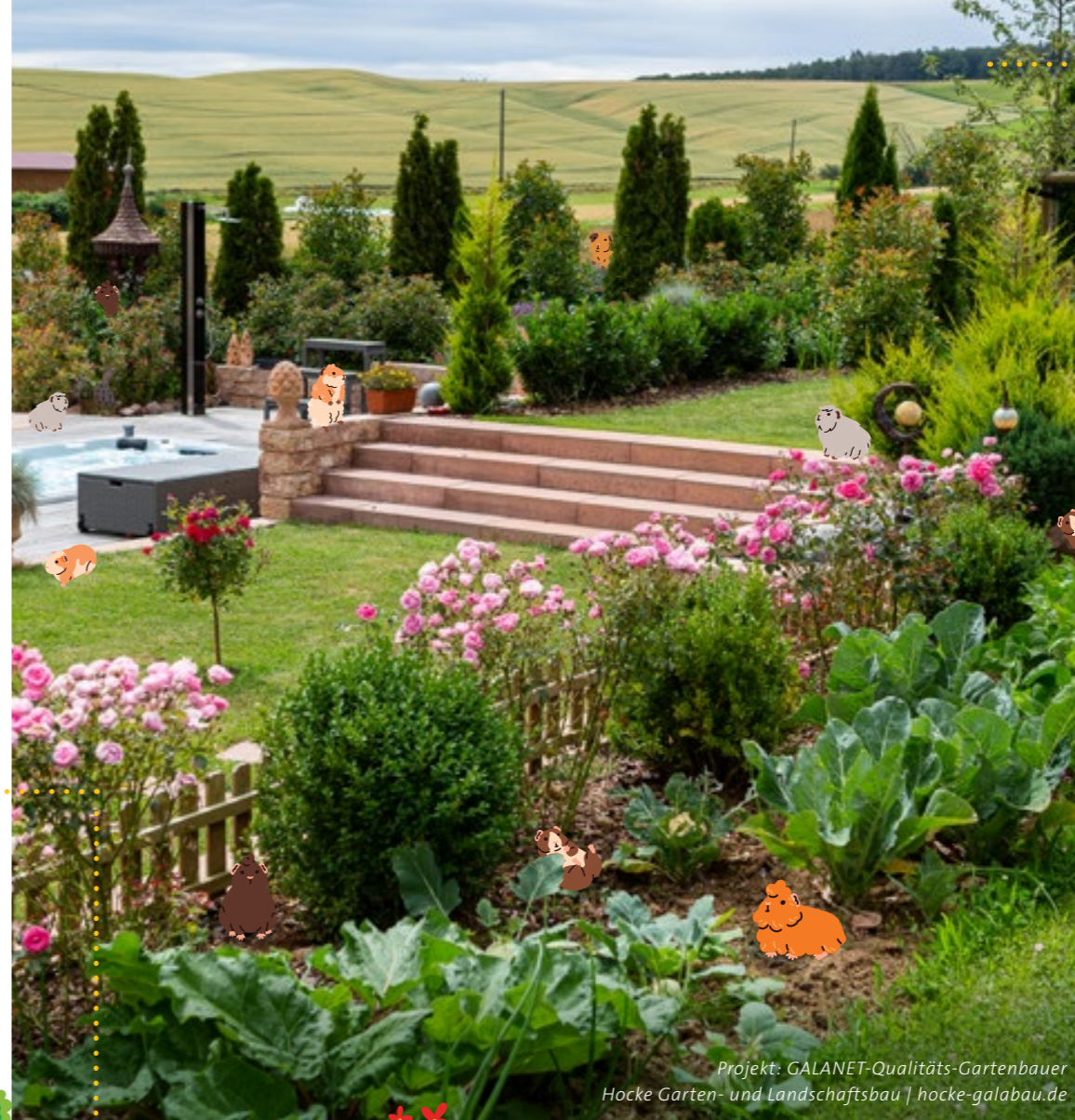
Projekt: GALANET-Qualitäts-Gartenbauer Hocke Garten- und Landschaftsbau | hocke-galabau.de